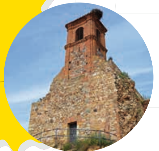
CASTILLO DE RETAMAR