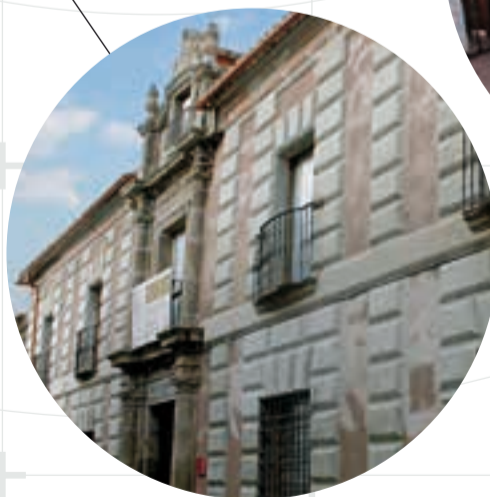
CASA ACADEMIA DE MINAS