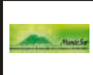
ASOCIACIÓN PARA EL DESARROLLO DE LA COMARCA DE ALMADÉN (MONTESUR)